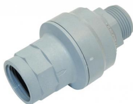
Waterblock til vaske- el. opvaskemaskine