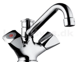
Børma batteri m. omskifter til brus