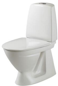
Alm. Ifö Sign toilet med S-lås