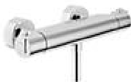
Alternia Image Termostat bpatteri