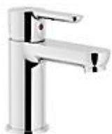
Alternia Image Håndvask-batteri