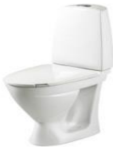
Alm. Ifö Sign toilet med P-lås