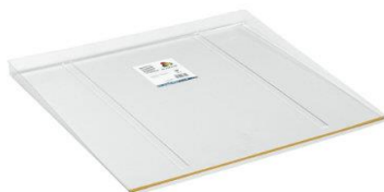
Opsamlingsbakke til vaske- el. opvaskemaskine