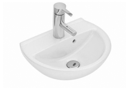
Ifö Spira håndvask 32 x 40 cm