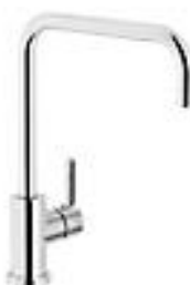
Alternia Image køkkenbatteri, L-tud