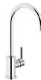
Alternia Iris køkkenbatteri, J-tud